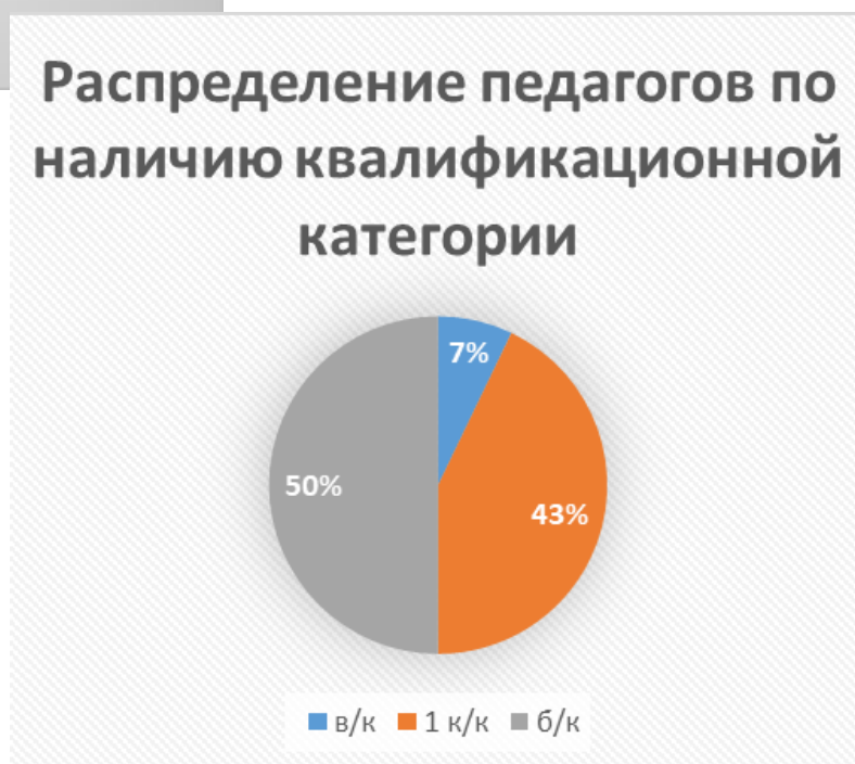
Рисунок 3. Распределение педагогов по наличию квалификационной категории